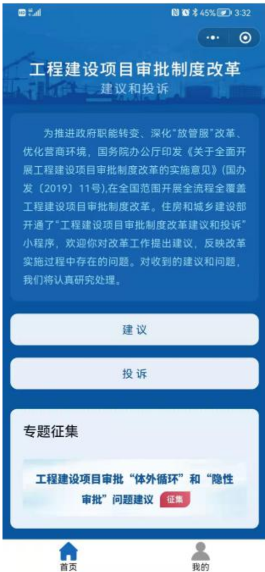
图2. “体外循环”和“隐性审批”问题建议征集专栏页面