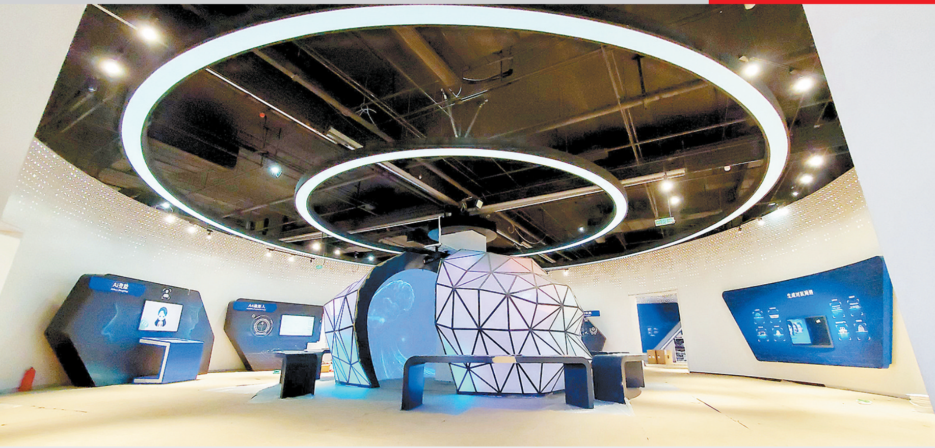
来一场奇幻的网络空间之旅