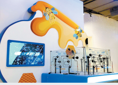
网络空间科技馆一角

本报讯 网络透明人、验证码劫持、智能门锁破解、网络技术链条展示……来网络空间科技馆体验一场奇幻的网络空间之旅。