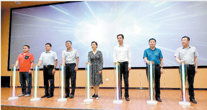
网络空间科技馆亮灯