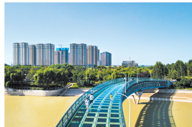
马晓飞作品《奔向蓝天》蓝天绿水之间的桥,通向梦想中的美好生活