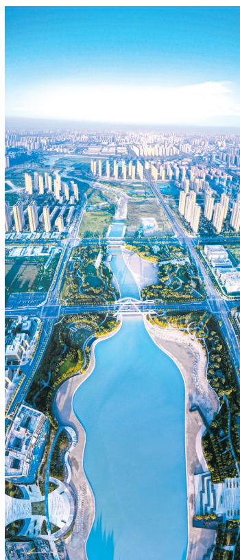
吴昊作品《天健湖全景》全新的角度,和谐的配色,生态之城跃然屏幕