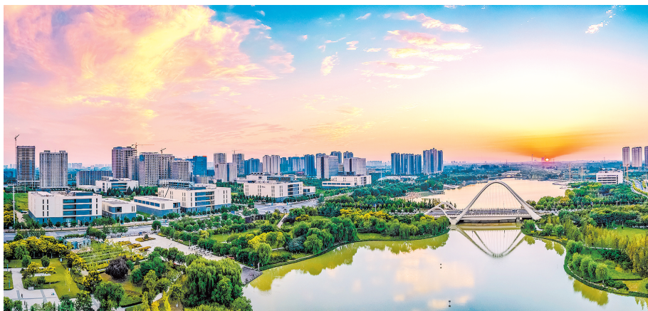
刘顺祥作品《霞光万里普照新城》日落,晚霞,夕阳下的双湖美得让人心醉