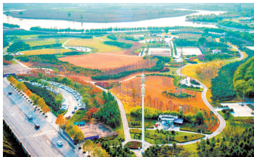
王玉德作品《多彩金秋》明艳的色彩勾勒出一派秋日盛景