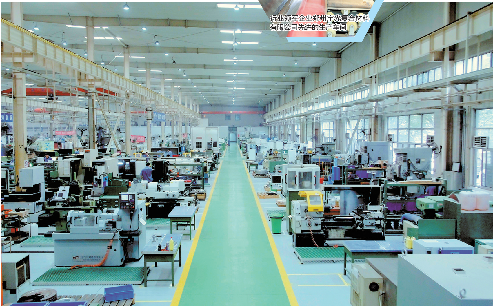
位于郑州高新区行业领军企业郑州磨料磨具磨削研究所有限公司