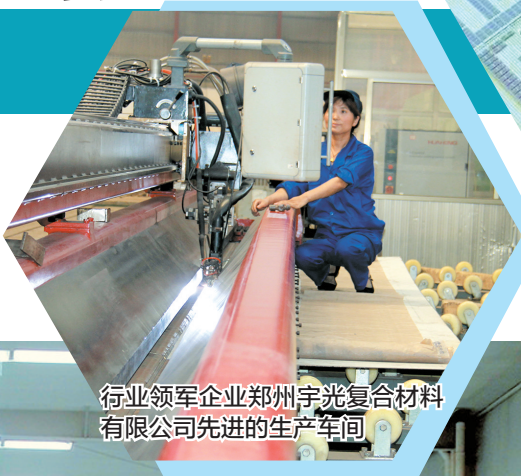
行业领军企业郑州宇光复合材料有限公司先进的生产车间