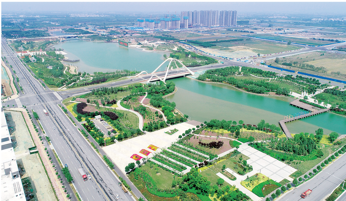
魅力天健湖