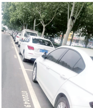
紧俏的标准停车位