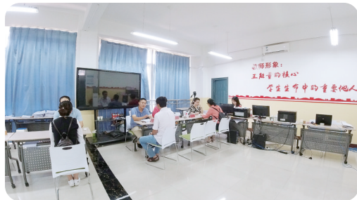
高新区招生办咨询现场

问题及时解答、梳理、协调,按照相关政策帮助家长解决或处理孩子入学报名过程中遇到的各种问题。