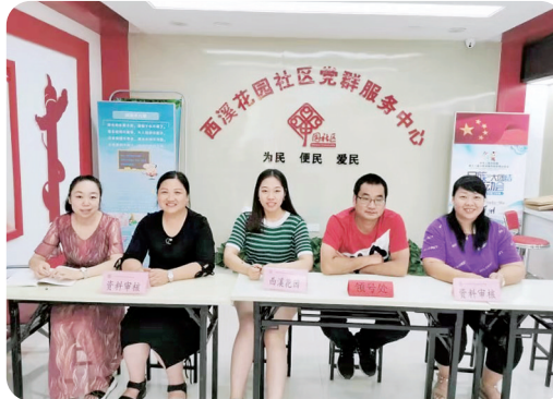
郑州中学附属小学化工路校区走进社区设立报名点