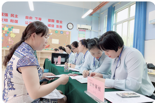
郑州中学附属小学报名处

7月中旬,社会事业局组织各学校、办事处、村委会和部分开发商召开政策研讨会,对2019年小学新生入学政策和划片范围进行研讨;8月14日,郑州高新区召开了全区小学新生入学工作会,印发、解读了2019年小学新生入学政策,对全区小学新生入学工作进行了详细安排;8月16日,教学管理科有关人员参加了媒体直播现场,介绍高新区入学政策,现场接受家长在线咨询。此外,社会事业局抽调有关人员组成4个督查组,到各个报名点察看报名登记准备和入学报名等情况,对整个报名工作进行督查。