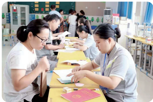
郑州市创新实验学校报名现场