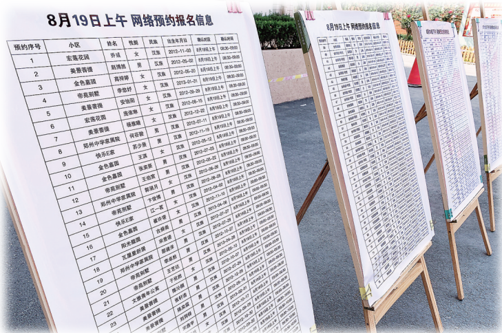
预约报名,井然有序