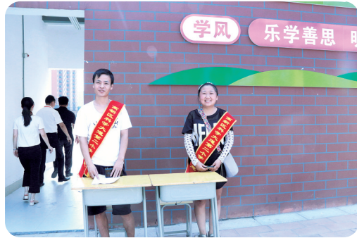
科学大道第二小学家长志愿者