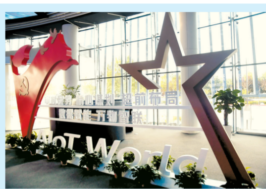
天健湖物联网产业园