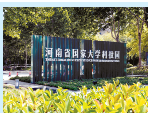
河南省国家大学科技园

河南省国家科技园作为国家级科技企业孵化器,依托全产业链孵化服务体系,为科技型创新企业带来发展的机遇和创新沃土。