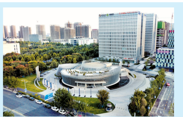
天健湖物联网产业园