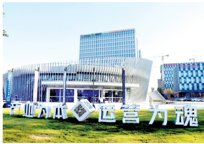
天健湖物联网产业园

栉风沐雨,辛勤耕耘。高新区用一个个耀眼的成绩诠释了高新之上再攀新高的“神奇密码”,踏步成为中国中部颇具竞争力的高新技术产业高地。