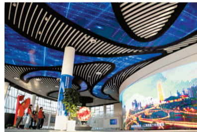
天健湖物联网产业园

9月26日,“非凡十年见郑成长,‘观观’带你看郑州”大型主题宣传活动采访团走进高新区,进驻西美高新的神秘领地,探寻高新之上再攀新高的“神奇密码”,解锁高新技术产业发展机密,体验“智美高新”多重魅力。记者 石闯 孙庆辉 程子鑫 见习记者 周梦真 高新时报 方宝岭/文 记者 李焱/图